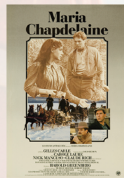
Maria Chapdelaine (Gilles Carle, 1983)

tant à la bande dessinée? (Yves Simoneau, 1983) The Tin Flute (Claude Fournier, 1983) La femme de l'hôtel (Léa Pool, 1984) La guerre des tuques (André Melançon, 1984) Jacques et Novembre (Jean Beaudry et François Bouvier, 1984) Louisiana (Louisiane) (Philippe de Broca, Jacques Demy et Étienne Périer, 1984) Sonatine (Micheline Lanctôt, 1984) Caffè Italia Montréal (Paul Tana, 1985) La dame en couleurs (Claude Jutra, 1985) Le dernier glacier (Roger Frappier et Jacques Leduc, 1985) Elvis Gratton : le King des Kings (Pierre Falardeau et Julien Poulin, 1985) Kamouraska : version intégrale du réalisateur (Claude Jutra, 1985) (nouvelle restauration en 2023) Le matou (Jean Beaudin, 1985) The Peanut Butter Solution (Opération beurre de pinottes) (Michael Rubbo, 1985) Visage pâle (Claude Gagnon, 1985) Bach et Bottine (André Melançon, 1986)