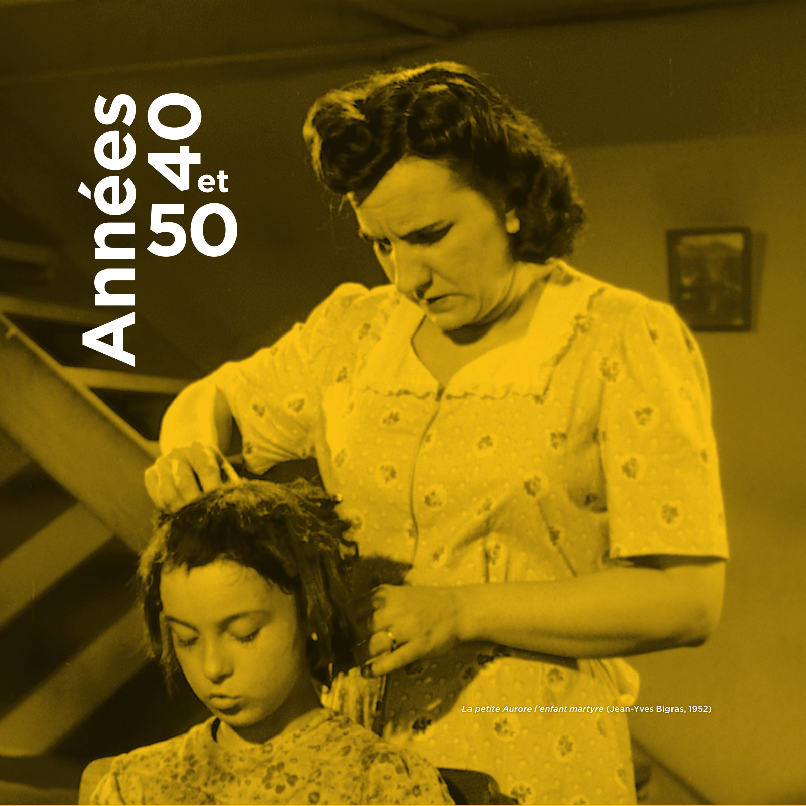
La petite Aurore l'enfant martyre (Jean-Yves Bigras, 1952)